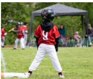
Die T-Baller waren bei zwei Turnieren erfolgreich.

Bei den Baseballern zahlt sich die gute Jugendarbeit allmählich aus. Es konnten einige Teenager in den Herrenmannschaften der „Hedgehogs“ Spielpraxis sammeln, sich weiterentwickeln und auch schon als Hilfen in einigen Situationen auszeichnen. Die Kleinsten, unsere T-Baller „Little Hedgehogs“ haben in diesem Sommer an zwei Turnieren teilgenommen und jeweils einen guten 2. Platz belegt. Der Spaß steht hier im Vordergrund und so ist der Zulauf im Training ungebrochen hoch. Das Saisonhighlight wird das Heimturnier auf dem eigenen Vereinsgelände am 22. September sein.