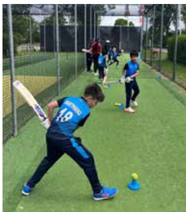
Trainingscamp unter Top-Bedingungen.

Das letzte Quartal war sehr arbeitsreich und bewegend, und wir konnten im Laufe dessen viel Positives verzeichnen. Beginnen wir mit den Kindern – den Broncos. Sie nahmen an zwei Outdoor-Turnieren in Karlsruhe teil. Im ersten belegten sie den 3. Platz und verloren in einem sehr knappen Halbfinalspiel. Beim zweiten Turnier verzeichneten die Broncos ihren ersten Turniersieg überhaupt. Es war ein großer Moment des Stolzes und der Erfüllung für unsere Kinder-Cricket-Community. Es gab noch zwei weitere Höhepunkte für die Broncos. Zuerst besuchte eine Gruppe den Amsterdamsche Cricket Club in Amstelveen, Niederlande für ein zweitägiges Camp während der Pfingstferien. Es war ihr erster Kontakt mit hochmodernen Cricket-Einrichtungen. Die Kinder hatten viel Spaß im Camp und es