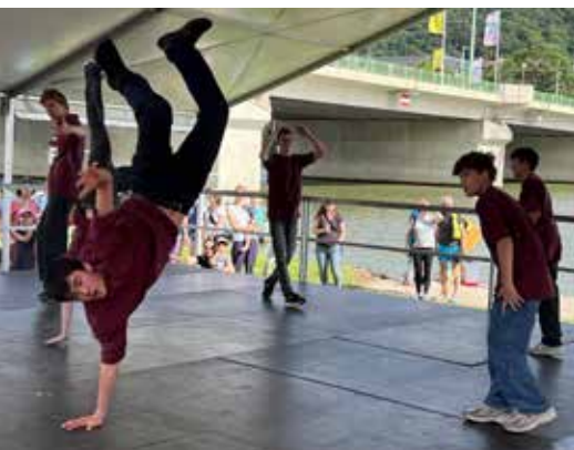
Aus dem Tanzstudio jump u.a. mit dabei: die Breakdance Teens

A lle zwei Jahre findet das Schaufenster des Sports