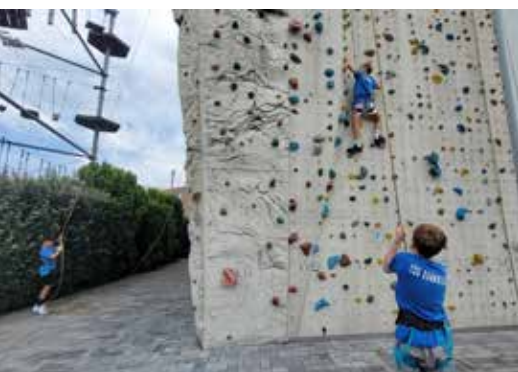
Klettern an der frischen Luft, das machte bei sonnigen Sommer-Temperaturen in Bensheim besonders viel Spaß.

Die erste Ferienwoche begann mit der 2. Auflage des Klettercamp EXTREME, bei dem Jugendliche im Alter von 12-15 Jahren verschiedene Kletterangebote in der Region auskundschaften konnten. Begonnen wurde mit einer Sicherheitseinweisung an der Kletterwand im Erlenweg mit allen wichtigen Sicherungskennnissen für die nächsten Camp-Tage. Hier standen vor allem Regeln und gegenseitige Kontrollen an vorderster Stelle. Auch Kooperations- und Vertrauensspiele gehörten zum Programm. Nach eineinhalb Tagen Sichern und Klettern ging es dann an Kletterwände anderer Hallen. Es ging ins benachbarte Kirchheim in die DAV-Halle, nach Bensheim ins High-Moves und nach Mannheim ins Smartclimb. In Bensheim verbrachten wir den Vormittag im Hochseilgarten mit zwei temporeichen Seilrutschen und nach einem gemeinsamen