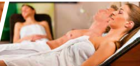
RUNDUM ERNEUERTER SAUNABEREICH

Aktionsvorteile nutzen und bis zu 300 €* sparen