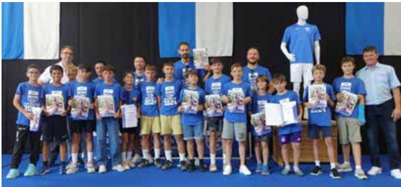
Die D-Junioren der Fußballabteilung wurden für die Meisterschaft in der Kreisstaffel ausgezeichnet.

terschaften in der Altersklasse U20. Carolin Marheineke wurde mit dem deutschen Veteranen-Team Weltmeister. Im Einzel belegt sie den 7. Platz bei der Weltmeisterschaft. Die Turnmädchen wurden Meister der Gauklasse B und Meister der Pflichtiga A. Die Nachwuchsfußballer, die D-Jugend, wurde Meister der Kreisstaffel. Die B-Jugend wurde Vizemeister der Kreisliga.