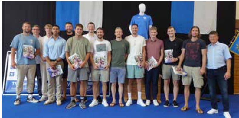
Die ersten Herren der Volleyballabteilung wurden für ihren Aufstieg in die 3. Liga geehrt.

de Verbandspokalsieger. Weitere sportliche Erfolge gab es aus den Abteilungen Fechten,