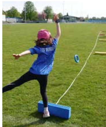
Egal ob im Freien, wie bei der Leichtathletik (oben) oder in der Halle beim Fechten (unten): die Kinder hatten viel Spaß beim Ausprobieren der vielen Sportarten.

auszuprobieren und sich in den jeweiligen Sporteinheiten auszuzeichnen. Auf dem diesjährigen Programm standen die Sportarten Bouldern, Fechten, Fußball, Kampfkunst, Leichtathletik, Tischtennis, Turnen und Volleyball. Abgerundet wurde das Programm mit allgemeinen Sportspielen, die zu Beginn eines Tages und zum Abschluss der Woche keinesfalls fehlen durften. Zwischen den Sporteinheiten