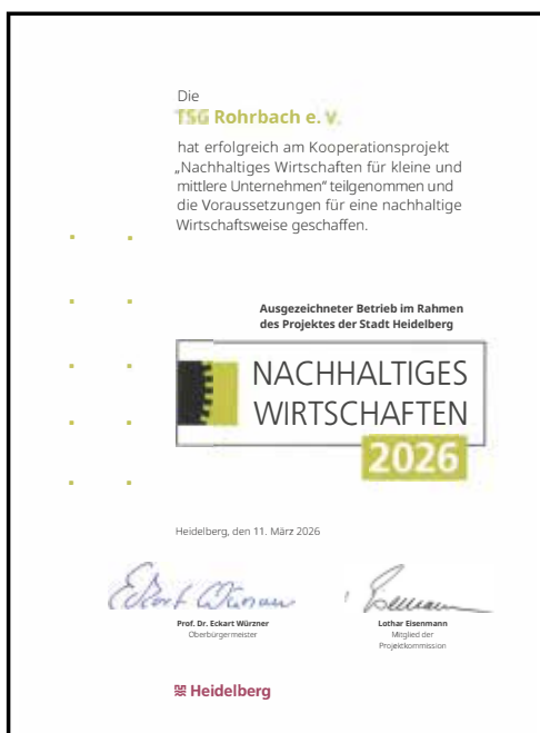
Urkunde Nachhaltiges Wirtschaften 2026 (links) und Urkunde Klimafit (rechts).