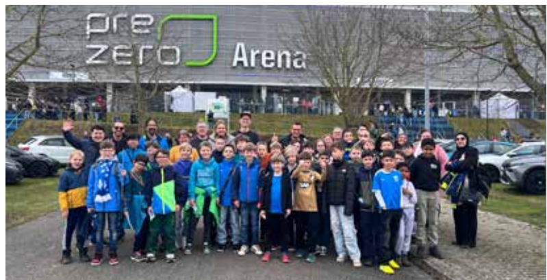
Die E1-Jugend beim Bundesligaspiel TSG 1899 Hoffenheim - FC St. Pauli

war deutlich spürbar. Trotzdem blieb die Stimmung positiv und die Kinder hofften in der zweiten Halbzeit auf eine Aufholjagd. Auch nach der Pause kämpfte Hoffenheim engagiert um den Ausgleich, doch der Ball wollte an diesem Tag einfach nicht ins Tor. Am Ende blieb es beim 0:1 für die Gäste. Trotz der Niederlage überwog bei den jungen Fußballern die Freude über das gemeinsame Erlebnis. Die Zugfahrt, die besondere Atmosphäre und das Mitfiebern im Stadion machten den Ausflug zu einem unvergesslichen Tag.