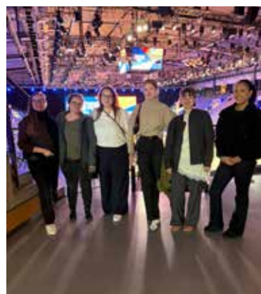
Ein Teil des Damenteam beim Porsche Grand Prix in Stuttgart.

umso mehr auf laue Sommerabende auf unseren Sandplätzen in Rohrbach. Und nach einer erfolgreichen Winterrunde und unserem gemeinsamen Tagestrip zum Porsche Grand Prix in Stutt-