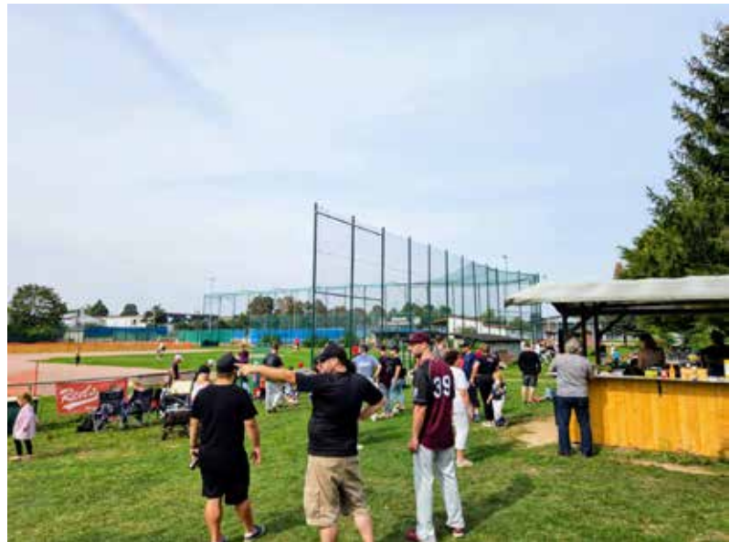
Impressionen vom Teeball-Turnier 2025

gen etwa der als Dirt bezeichnete Abschnitt des Feldes, der mit Sand bedeckt ist und eine scharfe Kante zum anliegenden Rasen aufweisen muss. Ebenfalls sehr aufwendig ist der Erhalt des sich in der Mitte des Infields befindlichen Mound, den man sich wie einen kreisrunden Erdhügel vorstellen kann. Wir sind sehr stolz darauf, dass wir unsere Spielfelder seit Jahren größtenteils durch ehrenamtliche Unterstützung von Spielern und Eltern in Schuss halten können. Das ist nicht selbstverständlich.