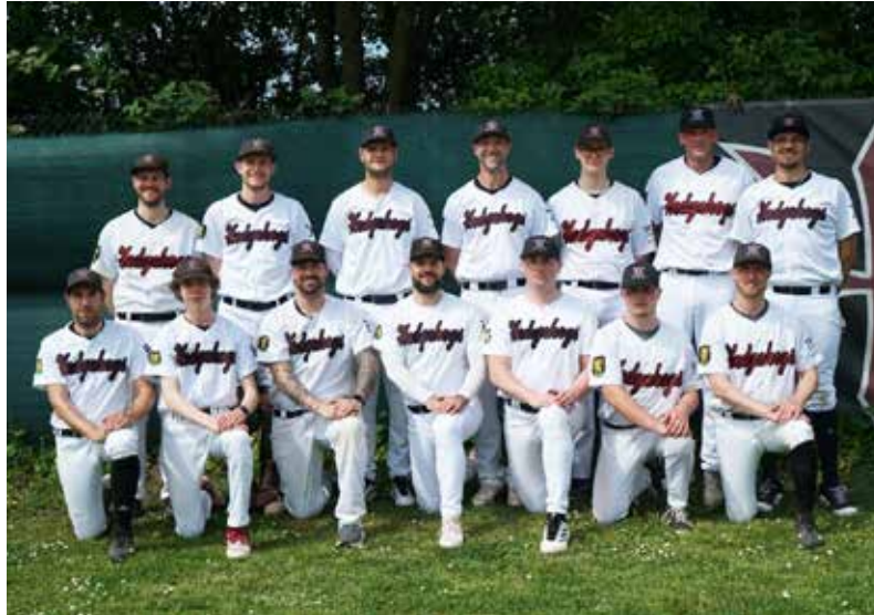
Verbandsliga-Herren 2026 der Hedgehogs

A us der Jugend gibt es ebenfalls aufregende Neuigkeiten. So darf die U10 der Heidelberger Baseballer an der erstmals ausgerichteten deutschen Meisterschaft in ihrer Altersklasse antreten. Das Turnier findet am 13. und 14. Juni in Ladenburg auf der Anlage der Romans statt. Da die Meisterschaft